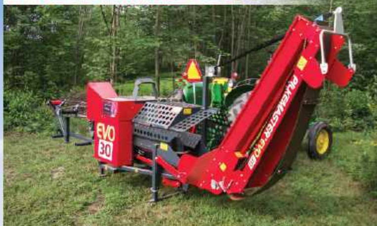
PROCESSEUR À BOIS